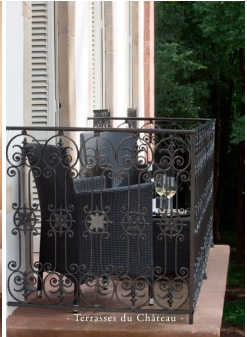
- Terrasses du Château -