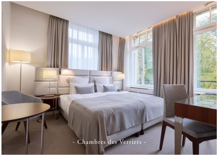
- Chambres des Verriers -