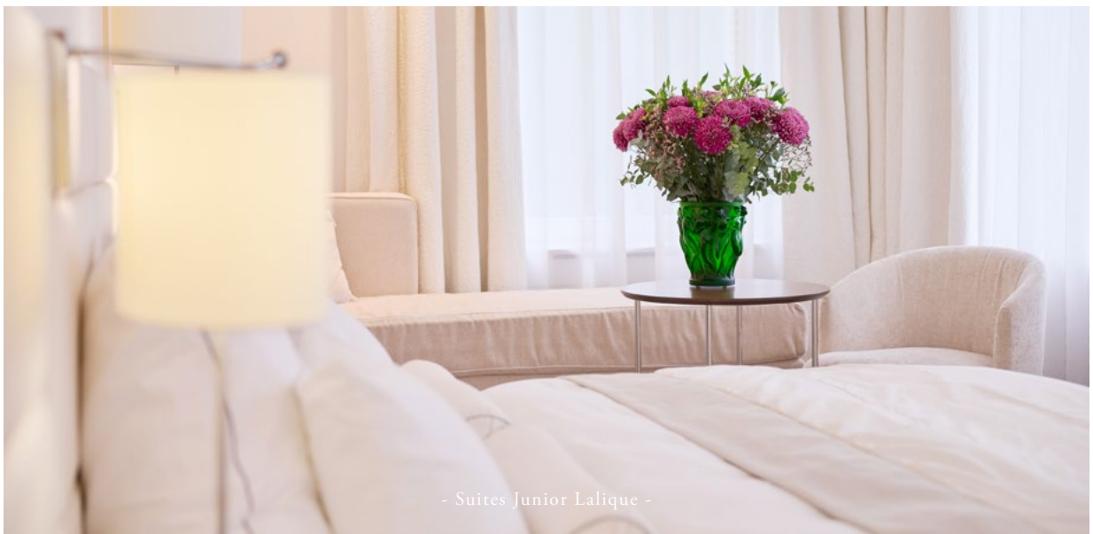
- Suites Junior Lalique -