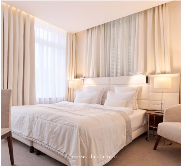
- Terrasses du Château -